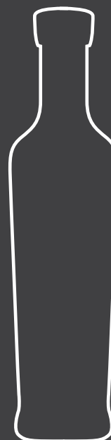
PRIMULA - 250 cl